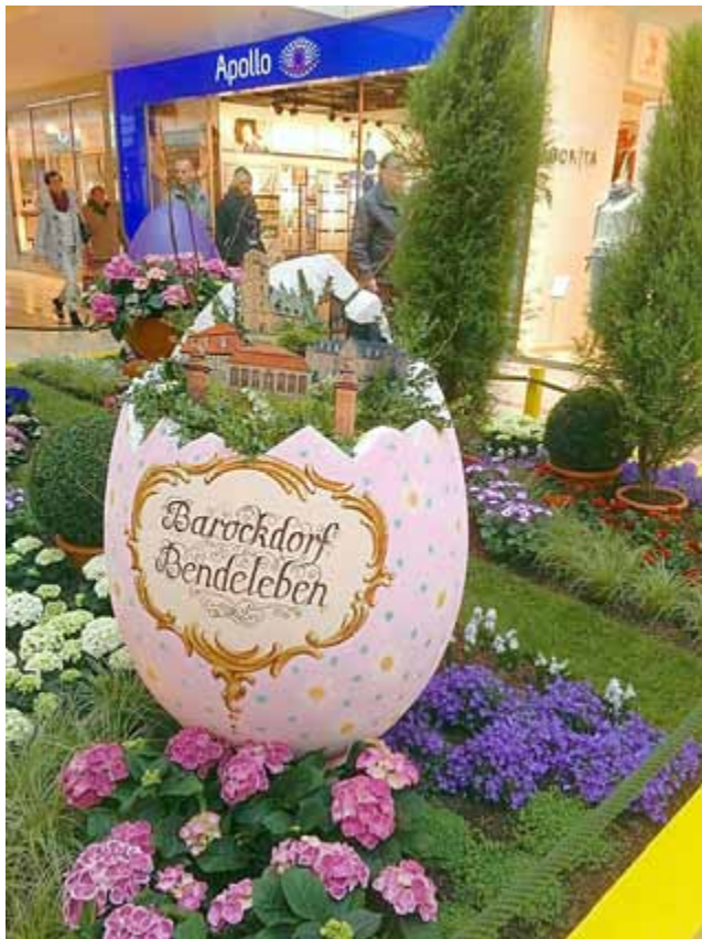
Knut Hoffmann Bürgermeister

Für alle Interessierten können die verschiedenen Ostereier der Außenstandorte der BUGA 2021 noch bis Ostersonntag im Erdgeschoss des ThüringenParks Erfurt angesehen werden.